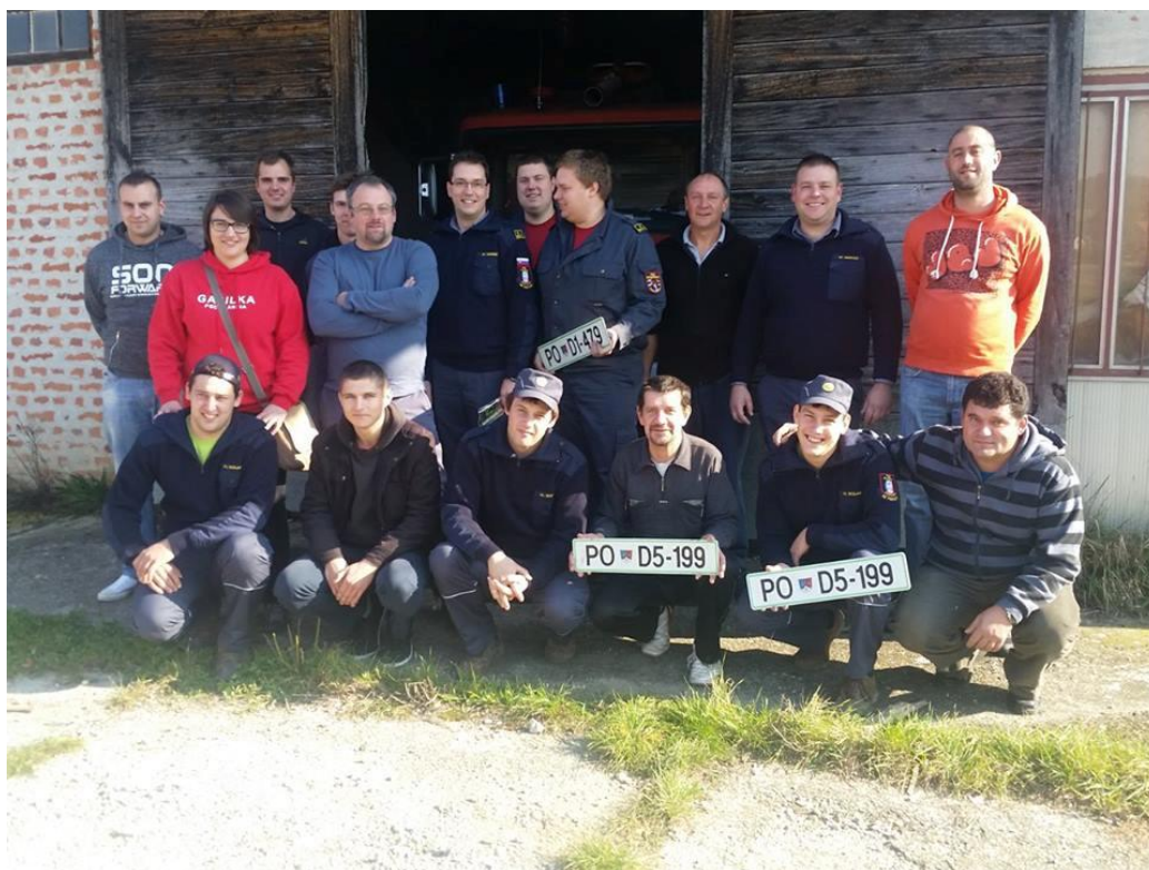
Fotografija št. 9: Obnova, širitev in otvoritev novega dela gasilskega doma v Planini, september 2010