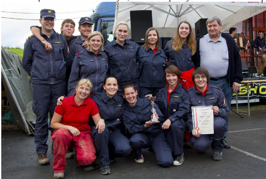
Fotografija št. 1: Desetina članic A na Občinskem tekmovanju na Studencu leta 2014 skupaj predsednikom GZ Postojna, Občinskim poveljnikom in takratnim županom