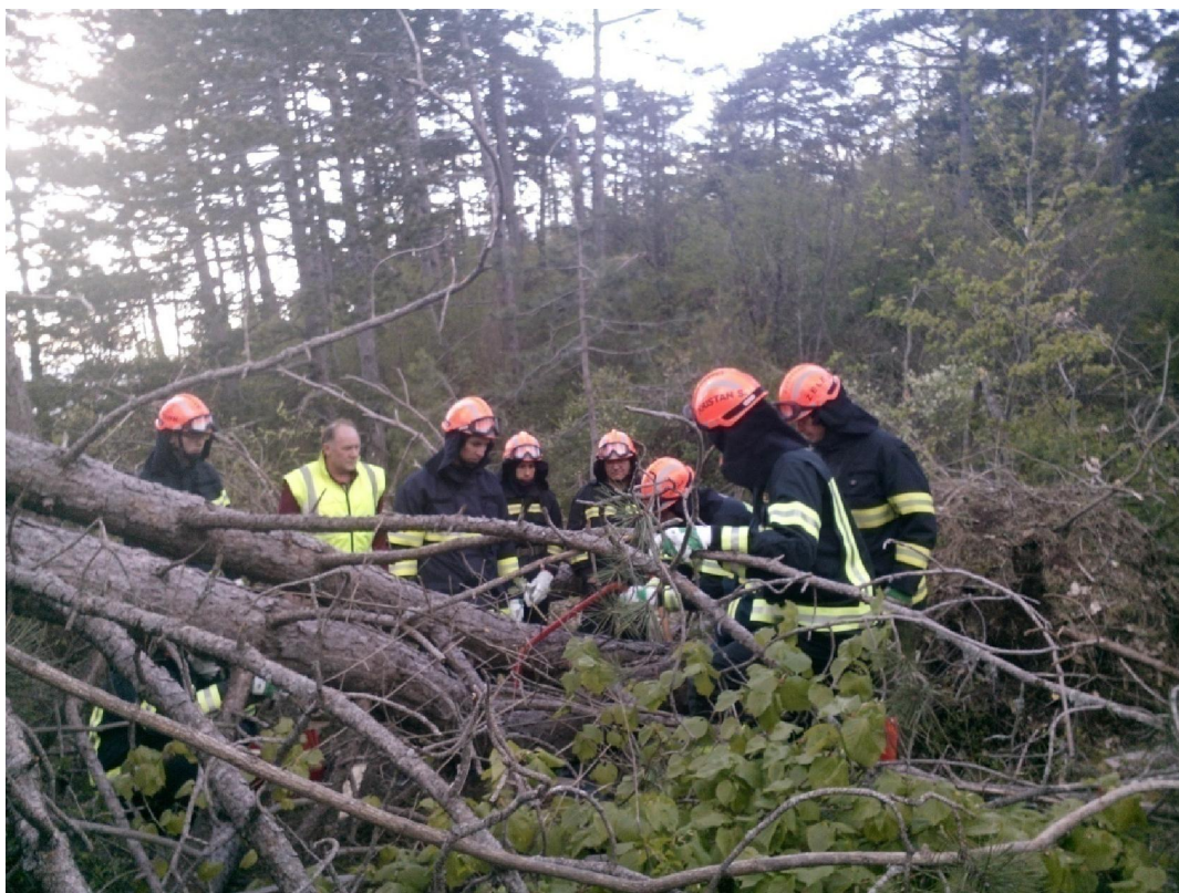
Fotografija št. 6: Ekipa pionirjev na tekmovanju