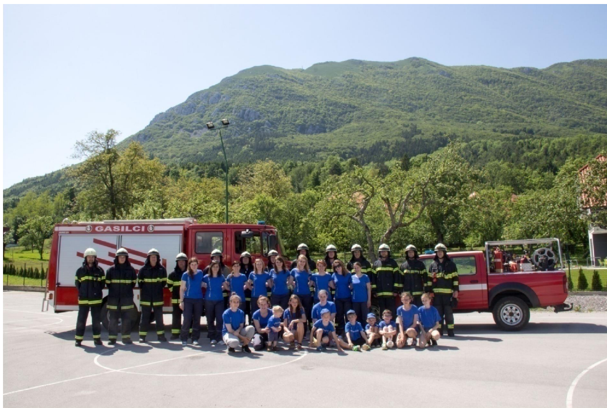
Fotografija št. 5: Operativna enota, maj 2016