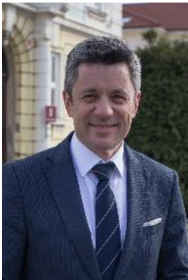
Ponos občine Postojna

Gasilke in gasilci ste nepogrešljivi del naše družbe. Ne samo, ko vas pokličemo na pomoč. Gasilci ste v zgodovini slovenstva eden izmed ključnih dejavnikov razvoja kulturne in narodne identitete. Kot župan sem zato neizmerno ponosen na vse dosežke vseh gasilk in gasilcev iz občine vseh generacij.