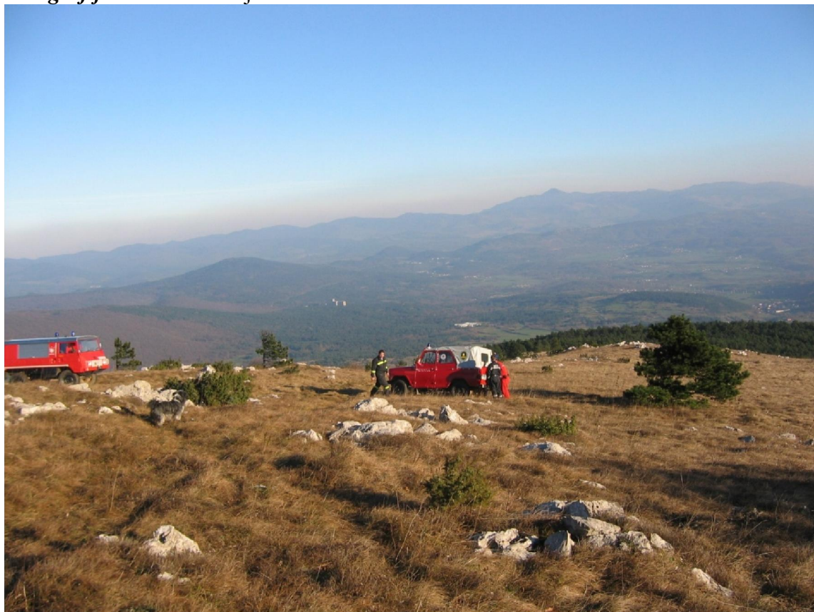
Fotografija št. 1: Prevoz ljudi in materiala na Vremščico

Zadnje dve leti se v okviru gasilskega krožka aktivno ukvarjamo z mladino ter se udeležujemo usposabljanj.