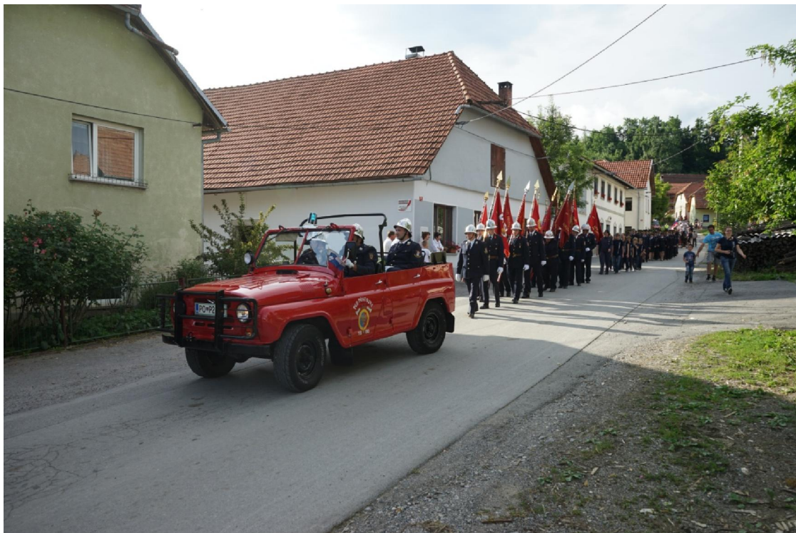
Fotografija št. 1: 30 let PGD Šmihel-Landol – gasilska parada

PGD Šmihel-Landol je danes razvrščeno v teritorialno gasilsko enoto I. kategorije. Pokriva območji KS Šmihel pod Nanosom s 171 in Landol s 148 prebivalci. Območji sta pretežno gozdnati, deloma travnati. PGD danes šteje 122članov, od tega 18 operativnih.