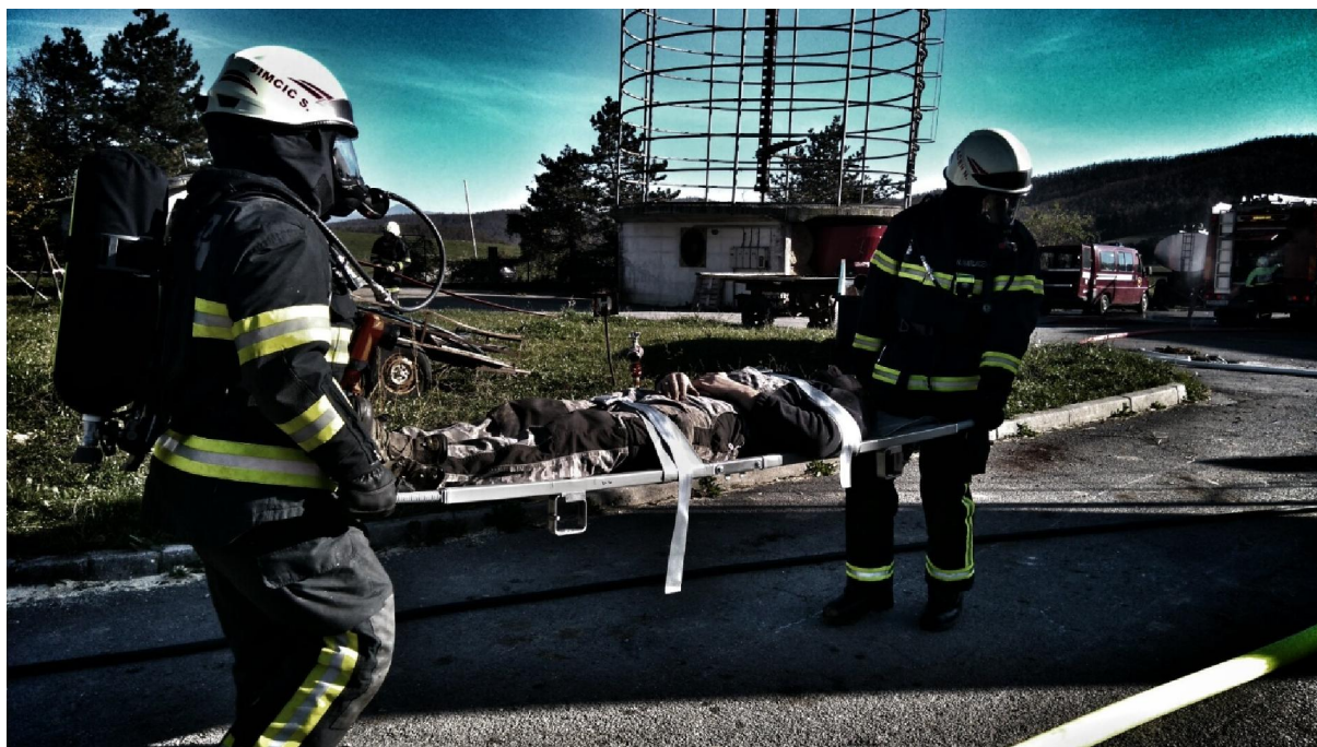
Fotografija št. 7: Operativna vaja na kmetiji Bertoncelj skupaj s PGD Razdrto in PGD Hruševje, oktober 2015