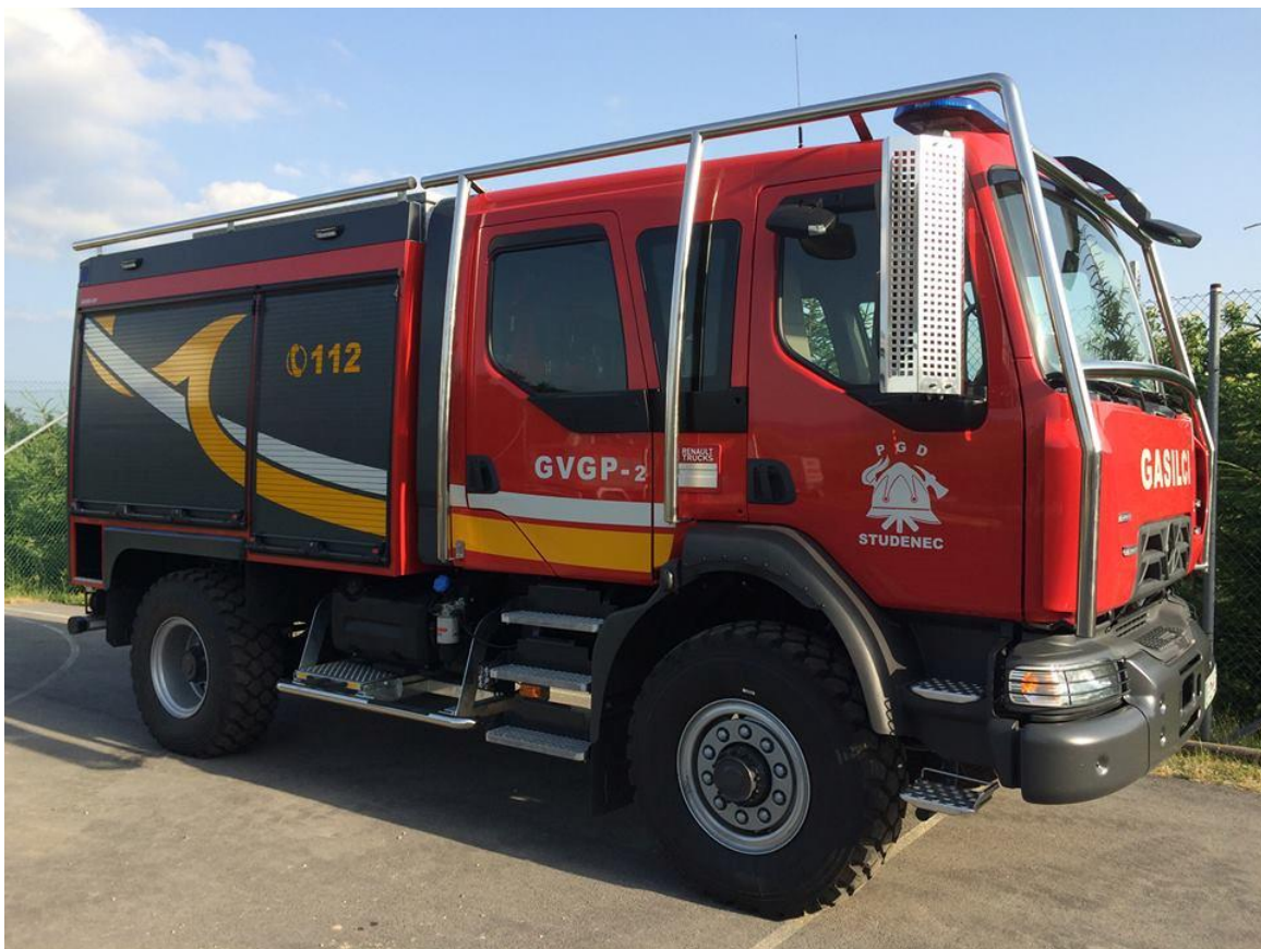
Fotografija št. 1: Novo gasilsko vozilo GVGP-2

Skrbeli bomo za čim boljšo usposobljenost vseh operativcev in se še naprej razvijali v koraku z sodobnimi smernicami zaščite in reševanja. Ena je tudi vključevanje reševalnih psov v gasilsko operativo, kjer bodo namenjeni iskanju pogrešanih oseb ter iskanju v ruševinah.