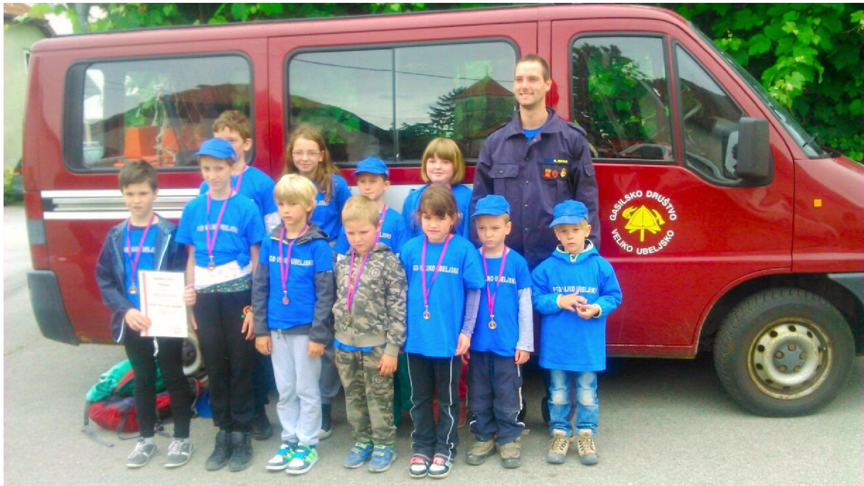
Fotografija št. 2: Novi operativni člani in članice, maj 2016