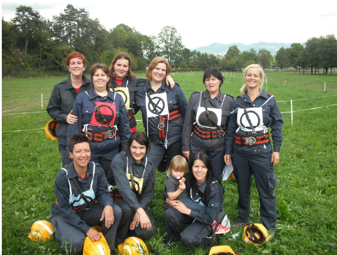
Fotografija št. 10: Vaje so ključ do uspeha na intervencijah